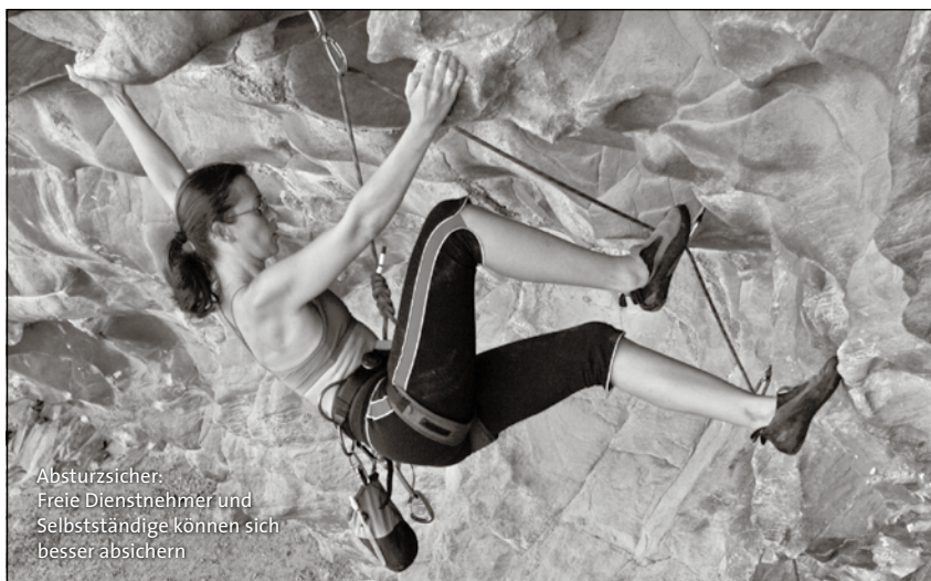
Absturzsicher: Freie Dienstnehmer und Selbstständige können sich besser absichern