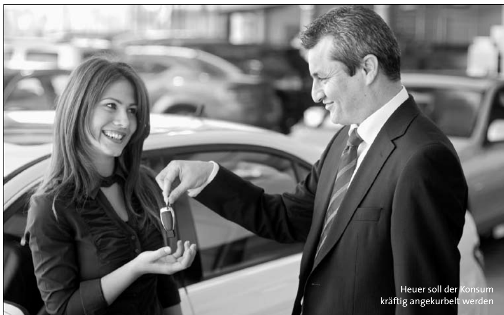
Heuer soll der Konsum kräftig angekurbelt werden

Aktuelles für Ihr Unternehmen von Mag. Nowak &amp; Team