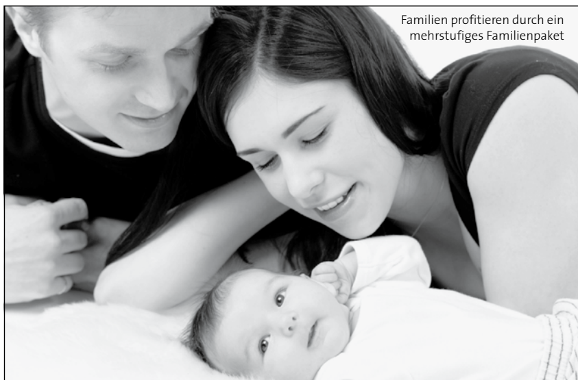
Familien profitieren durch ein mehrstufiges Familienpaket

versicherung angehoben wird, bringt die Steuerreform für Dienstnehmer maximal 1.252 € und für Selbstständige maximal 1.121 € (siehe Box 2).