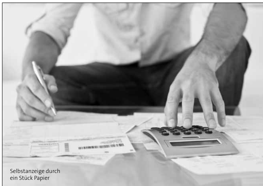
Selbstanzeige durch ein Stück Papier

Allerdings gibt es für den „Anzeiger“ seit 2010 eine wesentliche Erleichterung: Wenn der Täter die Umsatzsteuer im laufenden Jahr wissentlich nicht bezahlt hat oder zumindest bedingt vorsätzlich keine UVAs eingereicht hat, aber anschließend die korrekte Umsatzsteuerjahreserklärung unterschreibt, gilt er als „Anzeiger“. Für ihn erübrigt sich eine gesonderte Täternennung, die oft vergessen wurde. ●