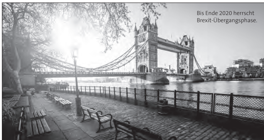
Bis Ende 2020 herrscht Brexit-Übergangsphase.