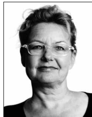
Dr. Maja Storch Motivationspsychologin und Buchautorin

Ja unbedingt. Im Bauchgefühl manifestiert sich das gesamte Lebensgefühl. Kluge Entscheidungen erfolgen nach bestem Wissen und im Einklang mit den Gefühlen. Wichtig ist eine realistische Einschätzung: Ich bin Experte, ich bin Greenhorn und brauche noch weitere Informationen von Experten.