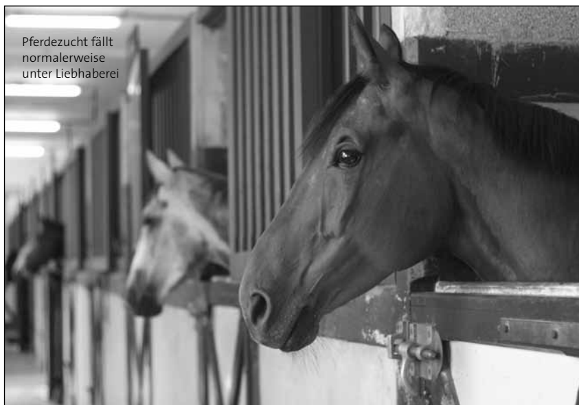
Pferdezucht fällt normalerweise unter Liebhaberei