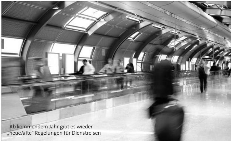
Ab kommendem Jahr gibt es wieder „neue/alte“ Regelungen für Dienstreisen