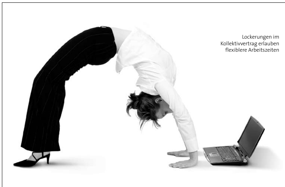
Lockerungen im Kollektivvertrag erlauben flexiblere Arbeitszeiten

Aktuelles für Ihr Unternehmen von Mag. Nowak &amp; Team