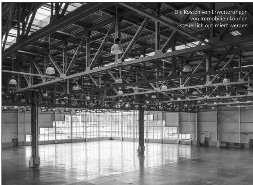
Die Kosten von Erweiterungen von Immobilien können steuerlich optimiert werden