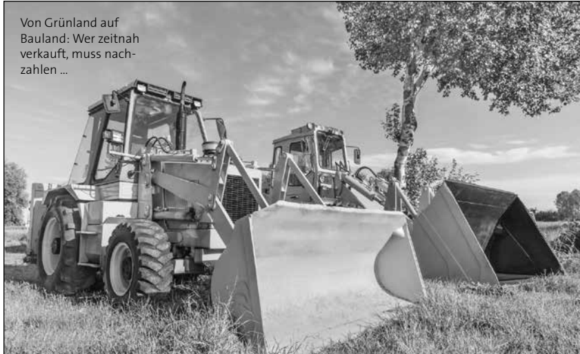
Von Grünland auf Bauland: Wer zeitnah verkauft, muss nachzahlen ...