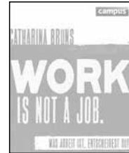
Work is not a job, Catharina Bruns, campus-Verlag, 2013