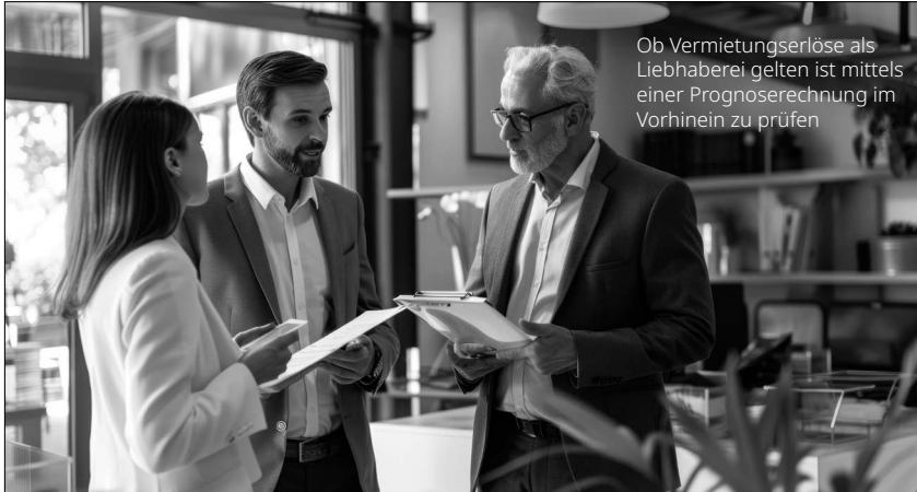
Ob Vermietungserlöse als Liebhaberei gelten ist mittels einer Prognoserechnung im Vorhinein zu prüfen