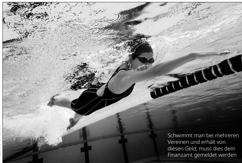
Schwimmt man bei mehreren Vereinen und erhält von diesen Geld, muss dies dem Finanzamt gemeldet werden

Kommt es bei Mehrfachbezügen zum Übersteigen der Monatshöchstgrenze, wird das vom Finanzamt im Rahmen von Ergänzungsersuchen erhoben und nachversteuert. Laut Finanzverwaltung darf zum Beispiel in einem Sportverein eine Person nicht gleichzeitig die PRAE und das Freiwilligenpauschale beziehen. Offen ist die Frage: Was gilt, wenn ein Sportler gleichzeitig auch als Funktionär tätig ist? Kann er in den „spielfreien“ Monaten, in denen er keine PRAE erhält, stattdessen das Freiwilligenpauschale erhalten? Diese und viele anderen Fragen harren noch einer Klärung. Wir hoffen, dass die entsprechenden Wartungserlässe zu den Lohnsteuer- und Vereinsrichtlinien nicht mehr lange auf sich warten lassen. ●