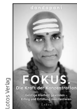
Dandapani: Fokus. Die Kraft der Konzentration Lotos Verlag

https://service.bmf.gv.at/service/allg/spenden/show_mast.asp